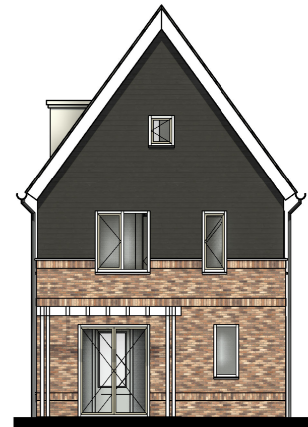
➤ Gevelaanzicht voorzijde